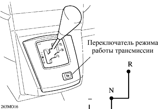
Рычаг мультимодальной коробки передач М-МТ и схема его переключения